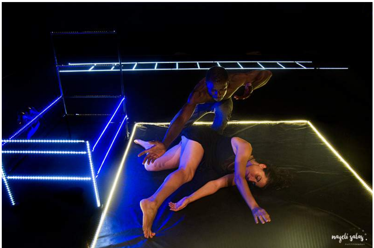
IL RISPETTO DI UNA PUTTANA