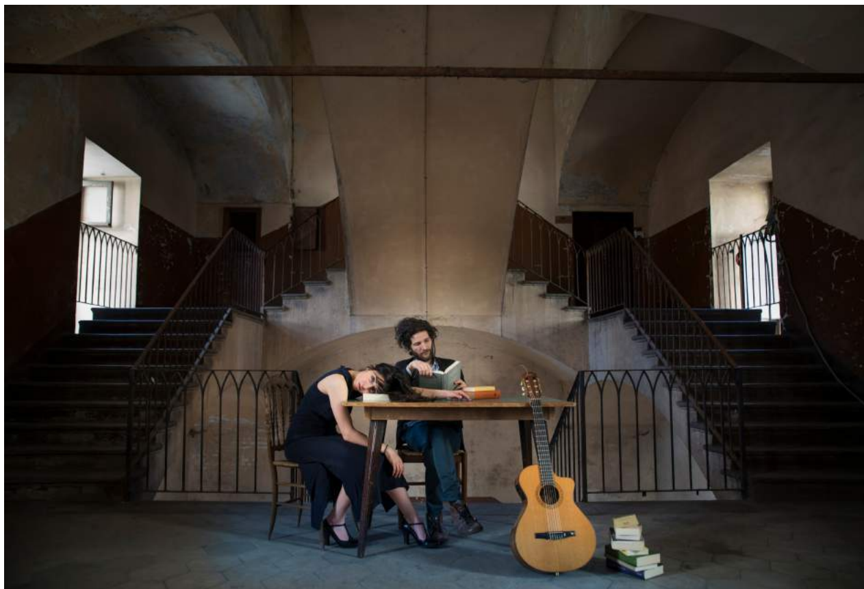
VAI VASCIO (Y NO TE PREOCUPES)