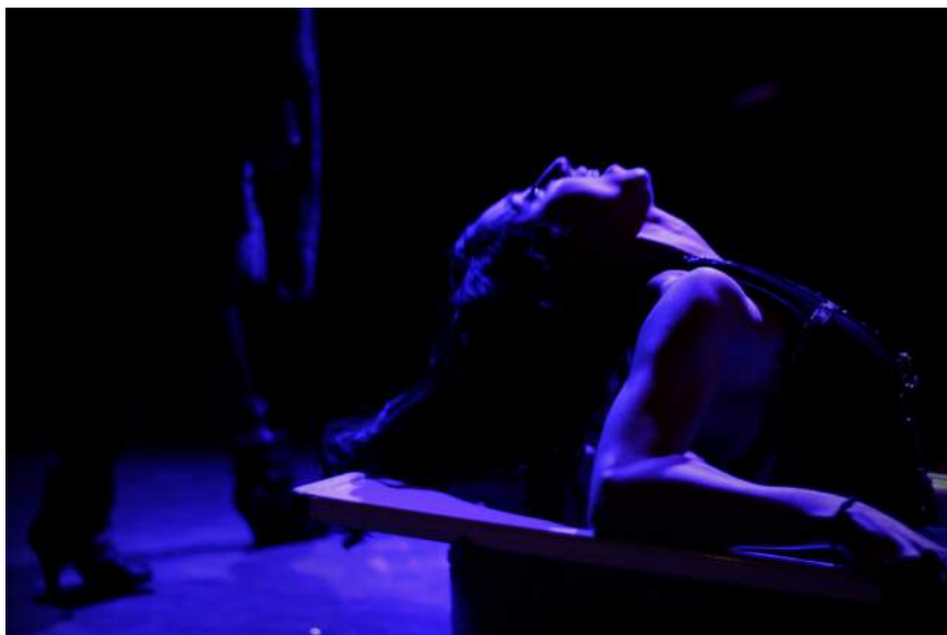
"¡Cuando paso, quedo, cuando quedo, voy!" LIGAZÓN, DE DÓNDE NO SE VUELVE